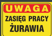
TBO - 88