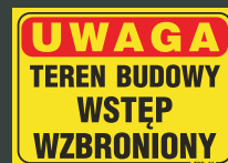
TBO - 61