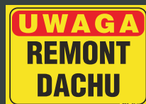
TBO - 78