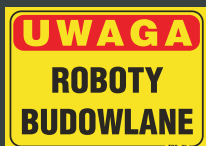
TBO - 76