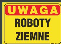
TBO - 72