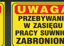
NM - 06