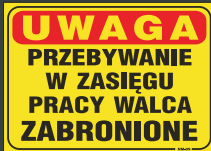
NM - 09