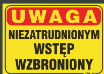
TBO - 64