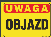
TBO - 59