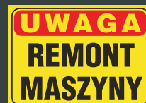
TBO - 92