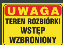
TBO - 65