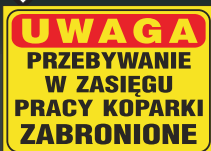
NM - 01