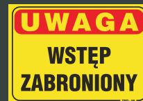
TBO - 56