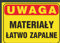
TBO - 83