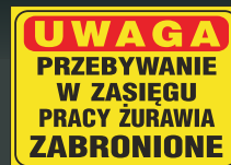
NM - 04