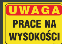
TBO - 86