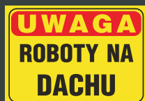
TBO - 87