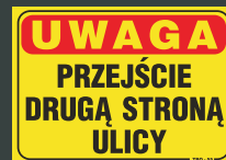
TBO - 55