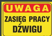
TBO - 53