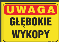
TBO - 70