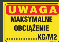
TBO - 85