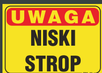
TBO - 82