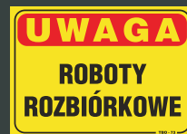
TBO - 73