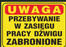
NM - 03