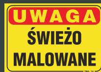
TBO - 74