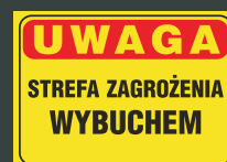
TBO - 68