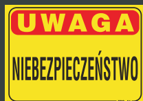
TBO - 51