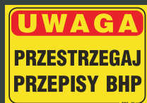
TBO - 75