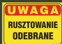
TBO - 89