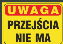
TBO - 57