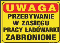
NM - 07