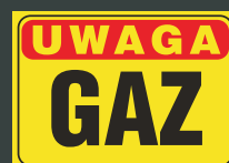
TBO - 67