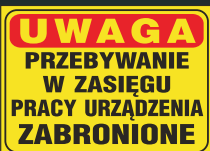
NM - 02