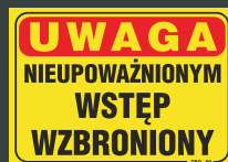
TBO - 60