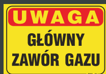
TBO - 81