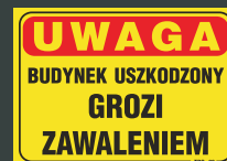
TBO - 80