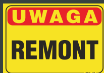
TBO - 77