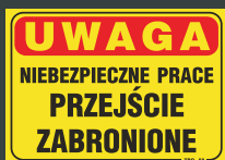
TBO - 58