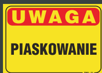
TBO - 71