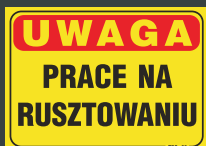
TBO - 52