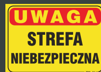
TBO - 84