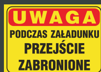
TBO - 66