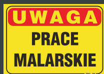
TBO - 69