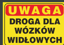
TBO - 91