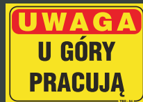
TBO - 54