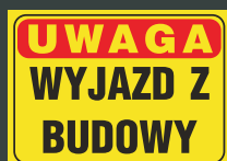
TBO - 63