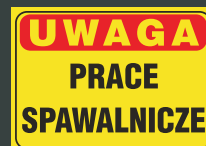
TBO - 94