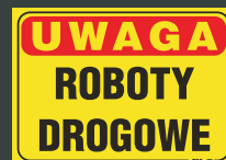
TBO - 79