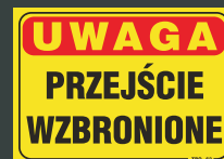
TBO - 62