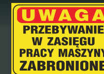
NM - 05